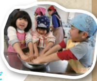
真冬のスローライフ体験