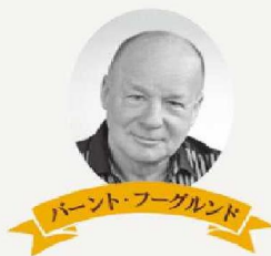
パーント・フーグルンド